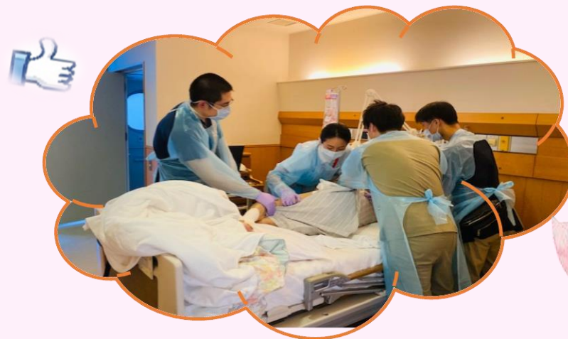
医師と巨大褥瘡処置に果敢に挑む